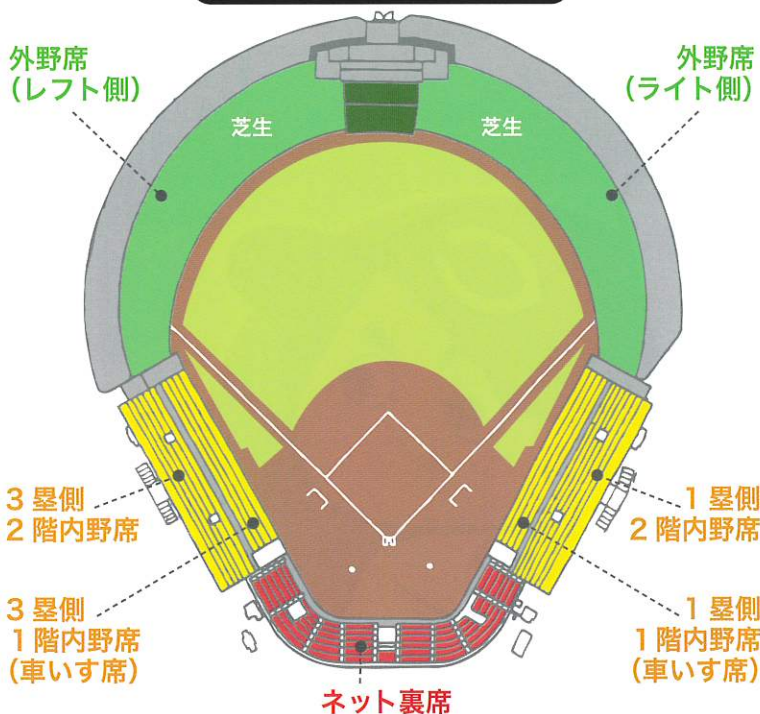
エブリー福山市民球場観戦座席図