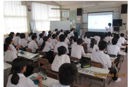
中間報告会の様子