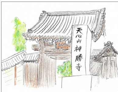
マップに載せる神勝寺のイラスト

4つのチーム（現地調査・マップ製作・PR(動画)・PR(その他)）に分かれて、活動を進めてきた1学期間の成果を報告し合いました。各チームが直面している課題や今後の活動について、改善策や意見を出し合いました。