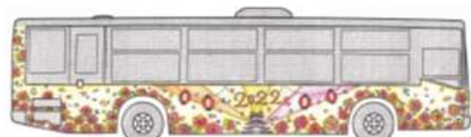
楽しくなけりゃ祭りじゃない! 福山ワッショイ!~ (幡井)

美術の授業でみなさんが取組んだデザイン画などの作品を応募した結果、幡井成美さん(31R 写真右)と山岸茉沙さん(21R 写真左)が優秀賞を受賞しました。応募数 7,387 点の中のトップ5です。