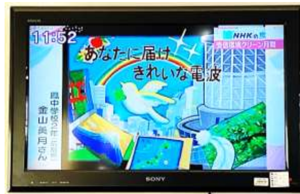
10月11日NHK 広島の地域情報番組「ひるまえワイド」で放送された一場面