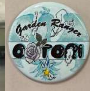
ガーデンレンジャー バッチの原画作成 楠本 光(22R)