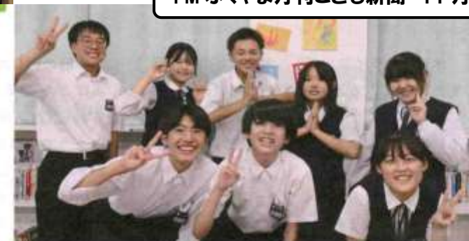
生徒会執行部の皆さん。