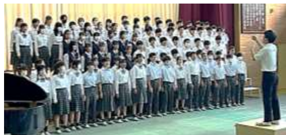
来賓の自治会長・PTA会長・保護司・小学校長の皆様には、審査委員をお願いしました。