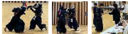
中根 悠臣・平佐 天雅 個人戦3位入賞