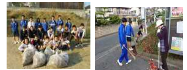
昨年度の地域合同清掃活動「クリーンプロジェクト」