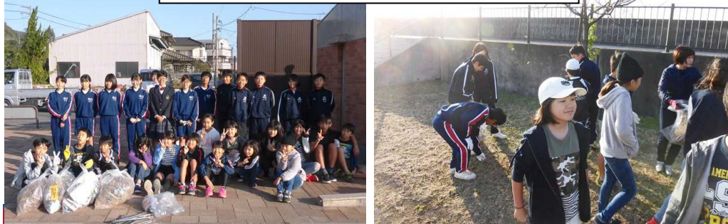
高島小と向丘中で「杏公園」掃除の様子