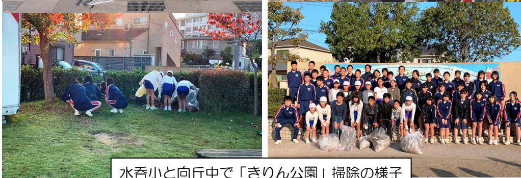
水呑小と向丘中で「きりん公園」掃除の様子