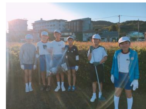
水呑小と向丘中で「きりん公園」掃除の様子

朝早くから起きて、少しねむかったけど、友達と一緒にゴミ拾いをがんばりました。塀の裏に、ゴミが多く捨ててありました。きれいになって気持ちよかったです。【児童の感想より】