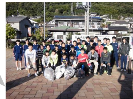
高島小と向丘中で「あんず公園」掃除の様子

朝早くから起きて、少しねむかったけど、友達と一緒にゴミ拾いをがんばりました。塀の裏に、ゴミが多く捨ててありました。きれいになって気持ちよかったです。【児童の感想より】