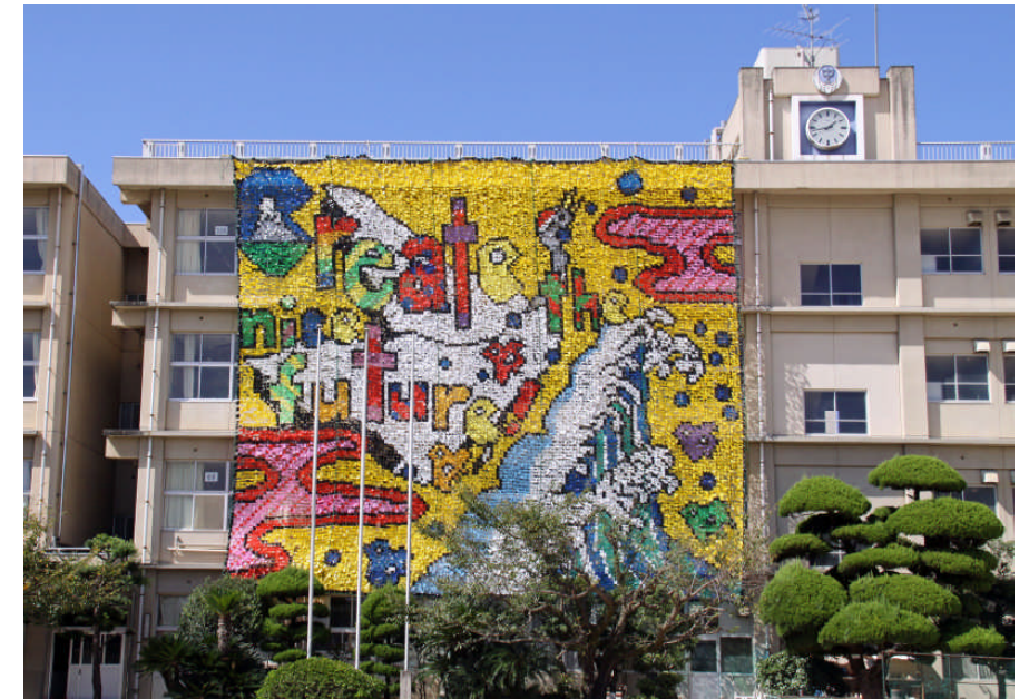
〔第21回 Create the nice future!〕