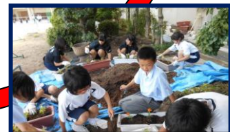
幸千中学校 美化作業