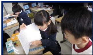
ペアで 千田小学校