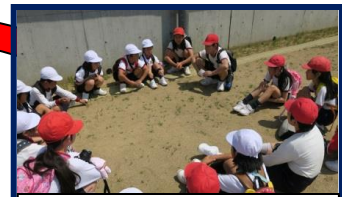
千田小学校 縦割りの活動