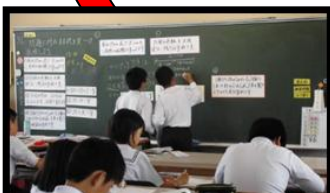
全体で 御幸小学校