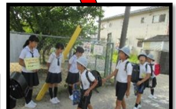
御幸小学校 挨拶活動