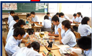
グループで 幸千中学校