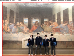
ダヴィンチ「最後の晩餐」