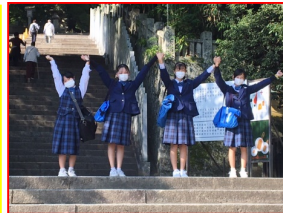
仲良く金刀比羅宮の参拝