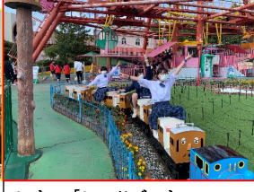
レオマ「レッツゴートーマス」