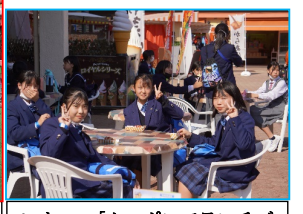
レオマ「クーポンでランチ」

— 2年生 修学旅行を振り返って (生徒の感想より抜粋) — ★「自分のことだけを考えていたら、人を待たせたり、集団での行動に支障が出るけど、皆のことを考えて、10分前に動いたり、人に声を掛けて戻るように指示したりしてくれた人がいたからこそ、この修学旅行は成功したんだと思います。考えて行動してくれた仲間に感謝します。」 ★「最初に行った大塚国際美術館では、天井まで美しい絵が描いてあり、とても感動しました。また、私の知らない絵や知っている絵がたくさんあり、こんな絵があるんだと思ったり、この絵にはこんな意味があるんだと、知らなかったことをたくさん知ることができ、とても勉強になりました。」