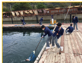
体験学習 30CM超の鯛釣り