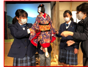
体験学習 淡路の人形浄瑠璃