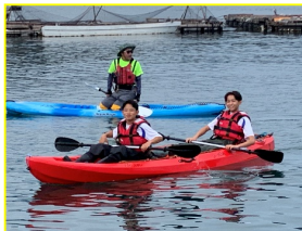
体験学習 シーカヤック猪進