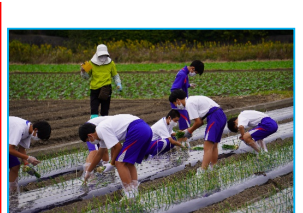
体験学習 玉ねぎの植え付け