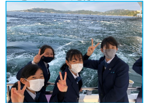
鳴門の「うず潮」クルーズ