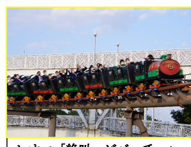
レオマ「絶叫 ビバーチェ」