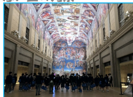
礼拝堂の天井画、圧巻でした