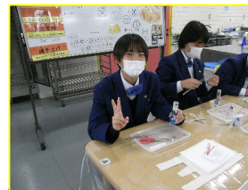
体験学習 キャンドルづくり