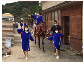
体験学習 乗馬 高さにびっくり