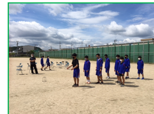
休日、部活に取組む陸上部の生徒たち