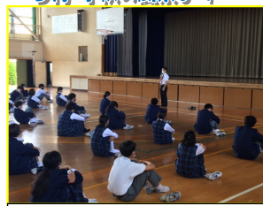
観察カードを持ち登校する生徒たち