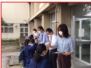
担任により検温を受ける生徒たち

経費及び管理の面で、御負担と御苦勞をお掛けし、使用開始後はなにぶん初めての取組で、 携帯電話同様、便利が良い分、幾つかの問題も生じることと思います。今学校では、生徒と共に 「学び(学習)」を支援する文房具として効果的な使用ができるよう、生徒会を中心に生徒が主 体的に考えたルールづくりに取り組んでいます。良いルールをつくり、落ち着いた学校の教育 環境づくりに保護者のお力添えは欠かせません。よろしく願いいたします。