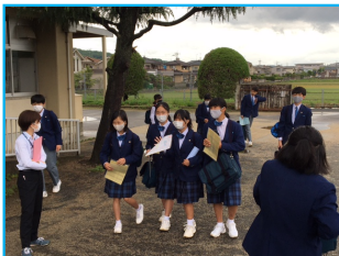
観察カードを持ち登校する生徒たち