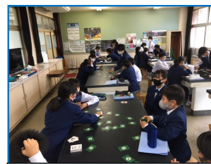
1年生、理科室での授業風景