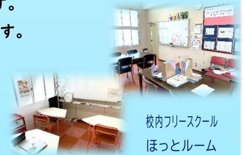
校内フリースクール ほっとルーム