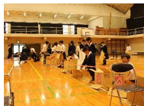
【地域貢献／防災減災DA V1】