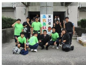
【地域貢献／ボランティア】