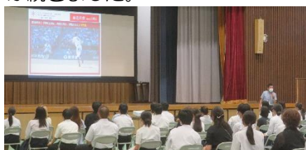
(下) 3年生高校進路説明会の様子。どの高校も熱心な説明が続きました。