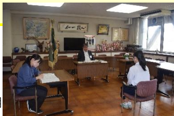
(右) 校長面接の様子。全員真剣に受け答えをしています。

また、職業についても、具体的な仕事内容やどうすればその職業に就くことができるかなど、夏休みを利用してきちんと調べておいてください。