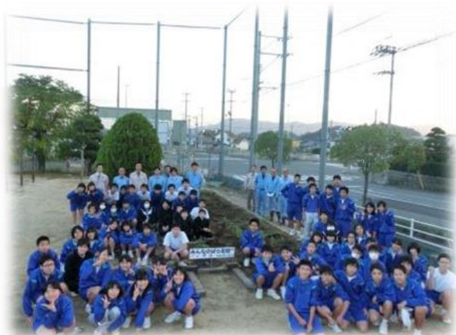
平成26年11月5日に完成した「みんなのぼら花壇」