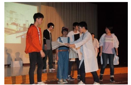
3年生 ミュージカル 「Mars Project」