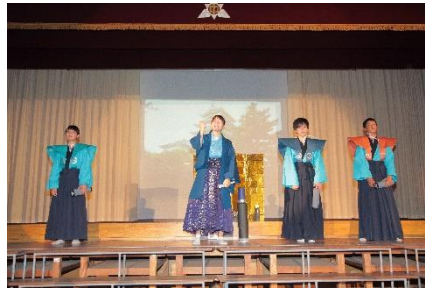
2年生 劇 「To Be Continue」