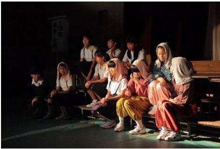
1年生 劇 「追憶～福山空襲～」

9月14日(土)文化祭を行いました。今年の生徒会のテーマは「開確 ～彩れ 仲間と築く新時代～」 各学年とも、生徒たちで工夫し改善し、より良いものに改良し創り上げてきました。全校合唱は「正解」という曲でした。歌詞の中に「答えがある問いばかりを教わってきたよ。だけど明日からは僕だけの正解をいざ、探しにゆくんだ」 この先、さらに多様化、複雑化していく社会に対して、正解だけでなく、自らの答えを仲間とともに導き出し、判断し、実行する、自分たちの将来を描いた曲を選びました。それぞれがいろんな思いをもって混成3部合唱に挑戦し合唱しました。