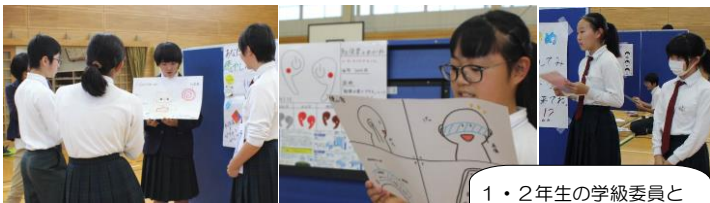
1・2年生の学級委員と 班長が色別で3年生の 午後学活を見に来ます！

授業参観・進路説明会にたくさんのご参加をありがとうございました。来年度への参考のため、「起業家プログラム」についてご意見・ご感想を頂けると幸いです。