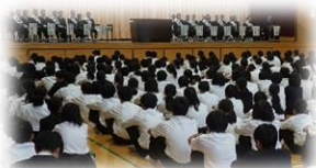
去年の立ち合い演説会の様子

運動部は8月の秋季総体を終えて新体制となり、初めての公式戦ですね。また、文化部も新体制となって新しい活動が始まりました。新生徒会役員の立候補募集期間も終わり、2年生がリーダーとして新しい城東中学校を築いていくときがやってきました。また、11月から修学旅行に向けた取組みも始まります。自分たちの力で創り上げていく修学旅行に向けて、クラス・学年で協力して準備を進めていきましょう。