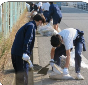
ご協力ありがとうございました