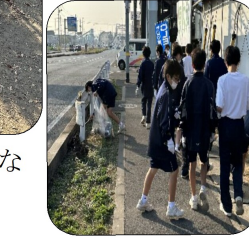
終了後の生徒の爽やかな笑顔が印象的でした。