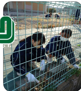
時間いっぱい作業をしました