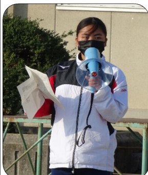
部活動委員会が中心になって進めました