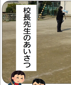
校長先生のあいさつ