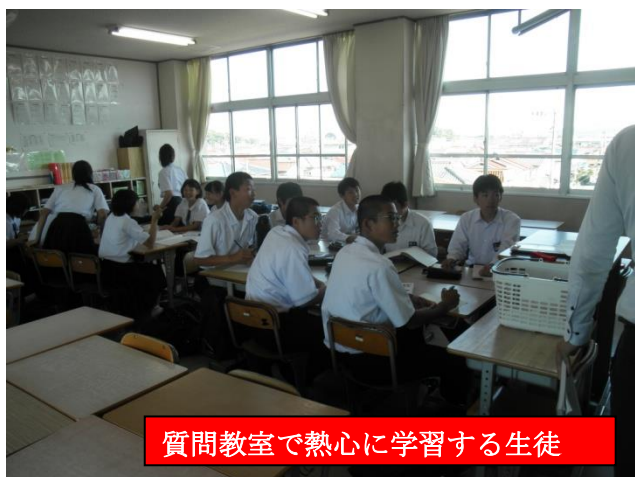
質問教室で熱心に学習する生徒

明日からいよいよ中間テストです。1年生にとっては初めての、3年生にとっては受検を占うテストの始まりです。では、3年生に今回のテストにかける意気込みを聞いてみました。