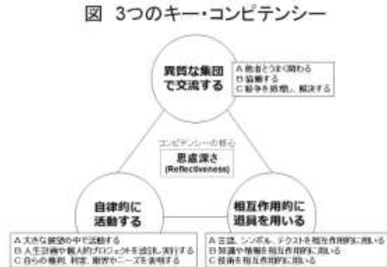
図 3つのコンピテンシー

コンピテンシーをどう生涯学習政策として活用しているかを明らかにします(平成 19～21 年度)。