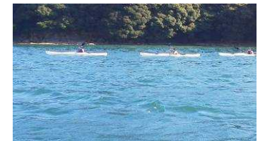
自然体験(シーカヤック)