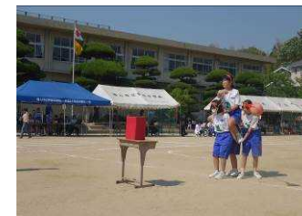
カンボーイ・カンガール