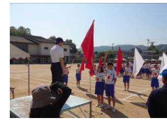
両団長による選手宣誓