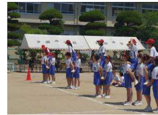
天下分け目の合戦