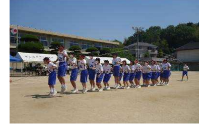
ジャンプでつなごうクラスの輪