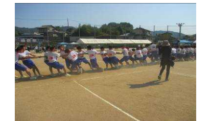
引いて引いて引きまくれ