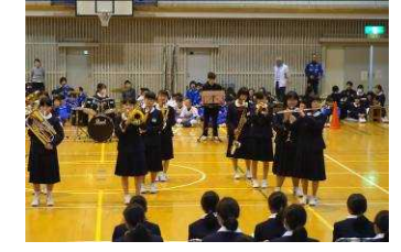
<部活動紹介 吹奏楽部>